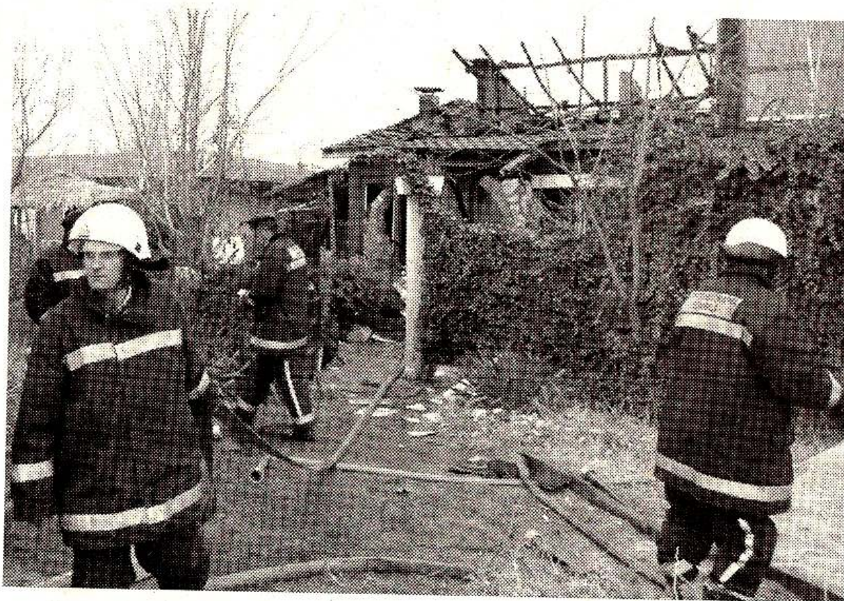
Дури кога ќе се случат големи пожари, граѓаните масовно прават осигурителни полиси

Компаниите нудат различни понуди и осигурување на живеалиштето од повеќе ризици. Цената, просечно, е од 1.000 денари годишно па нагоре. За цена од 1.000 денари живеалиштето е осигурано од пожар, кражба ка-