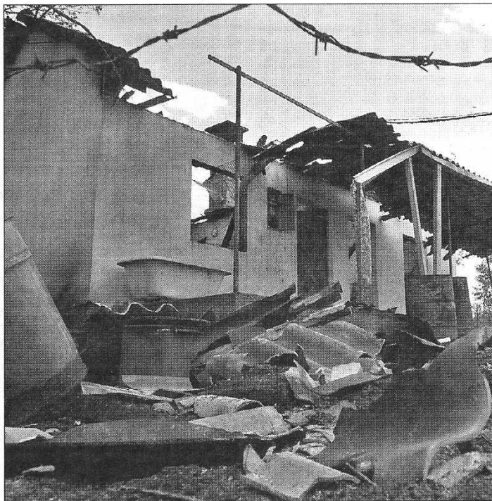
Целосно изгоре вилендичка во завчерашниот пожар во Катланово

Пожарот во Катланово, кој избувна завчера и беше локализиран доцна вечерта, вчера повторно се распламти. Службите на Контролата на летање вчера изутрина забележале чад на 15 километри западно