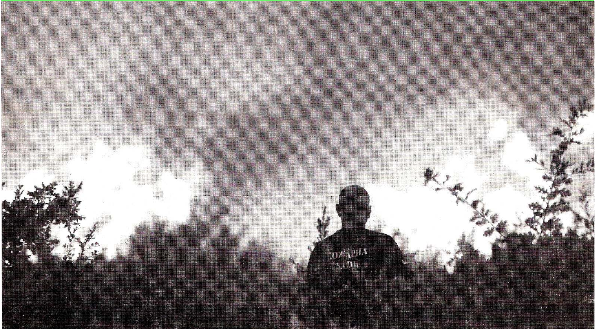
Набргу во Македонија пожар ќе гасат и авиони