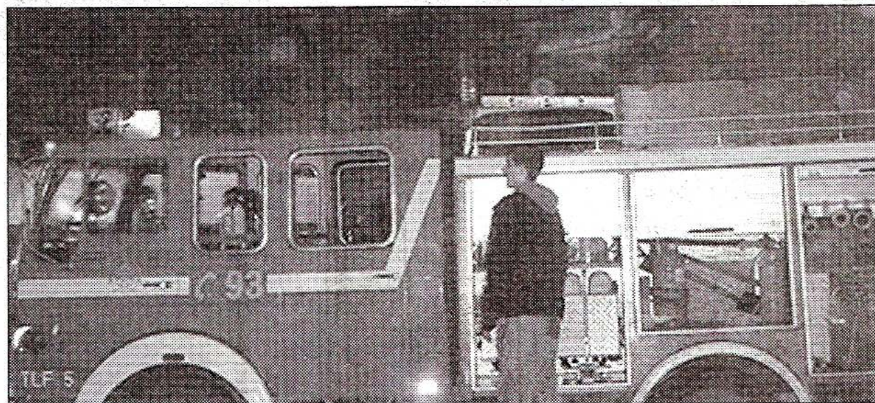
Пожарникарите интервенирале бргу, но кафулето целосно изгорело

- Засега може да кажеме дека седум луѓе го загубија животот, а тројца се потешко повредени.