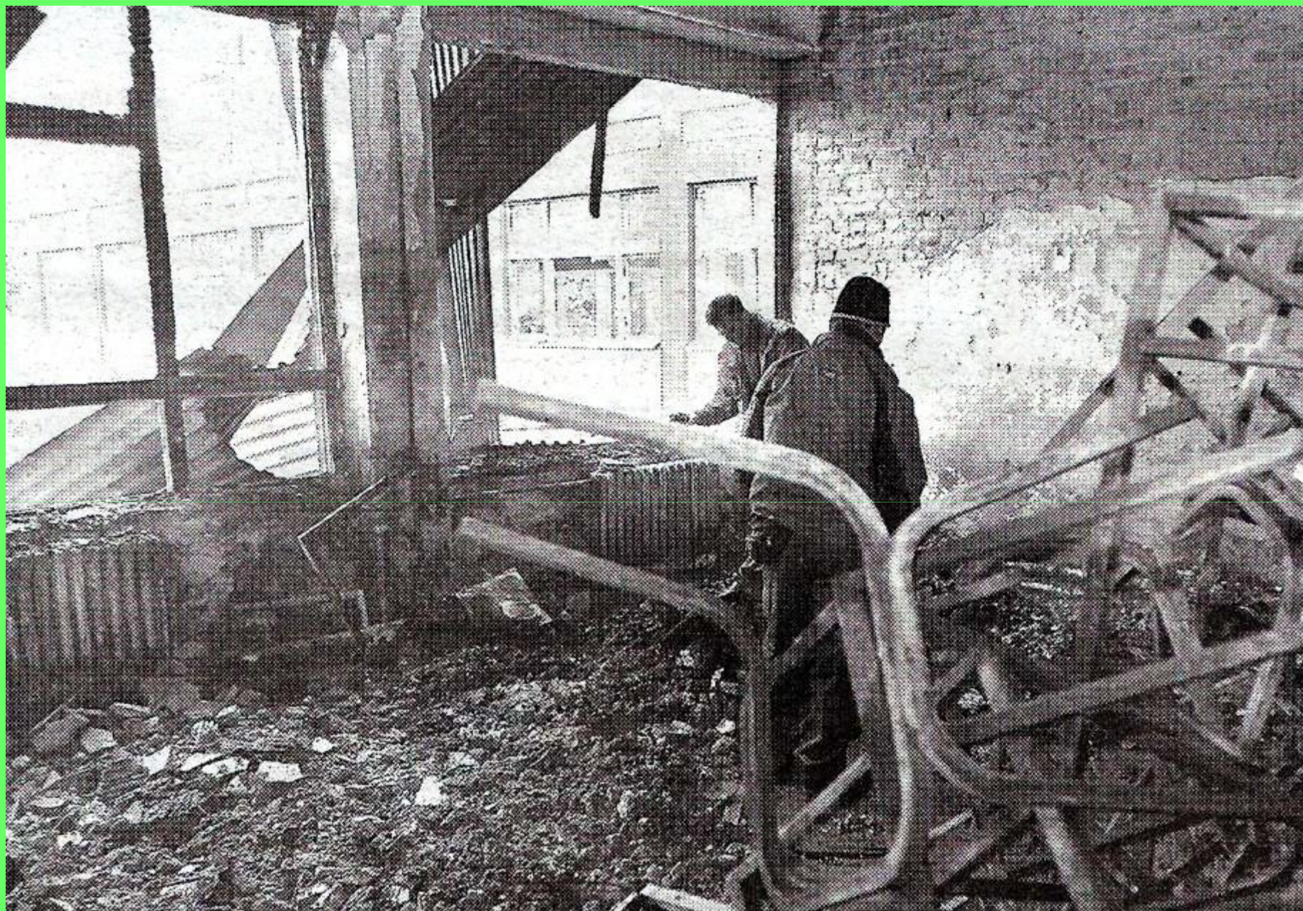
ПОЖАР ВО ОСНОВНО УЧИЛИШТЕ 11 ОКТОМВРИ